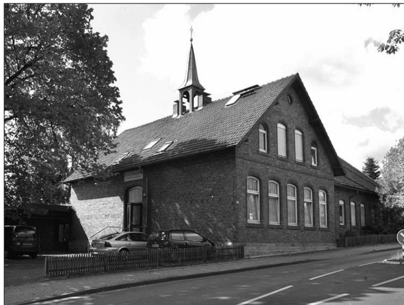
Die Alte Schule in Deppendorf soll am kommenden Mittwoch per Unterschrift beim Notar endlich verkauft werden.