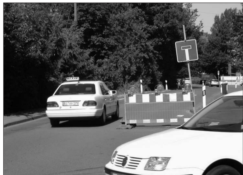
Wer nicht Anlieger der Grafenheider Straße in Brake ist, fährt hier quasi in eine Sackgasse. Und da haben dann vor allem die Lkw Probleme beim Wenden.